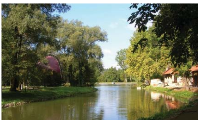
A természeti értékek változatossága határtalan