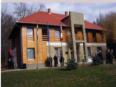
Az önkormányzati tábor és park főépülete