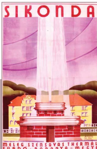
A gyógyszálló korabeli plakátja