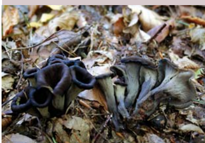
Trombitagomba – nehéz rábukkanni, de egy lelőhelyen rengeteg van!