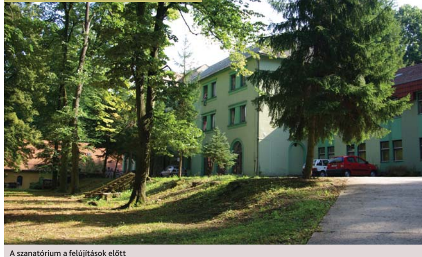
A szanatórium a felújítások előtt