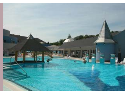
A magánkézben lévő új fürdő