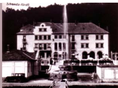
A szanatórium – még régi fényében